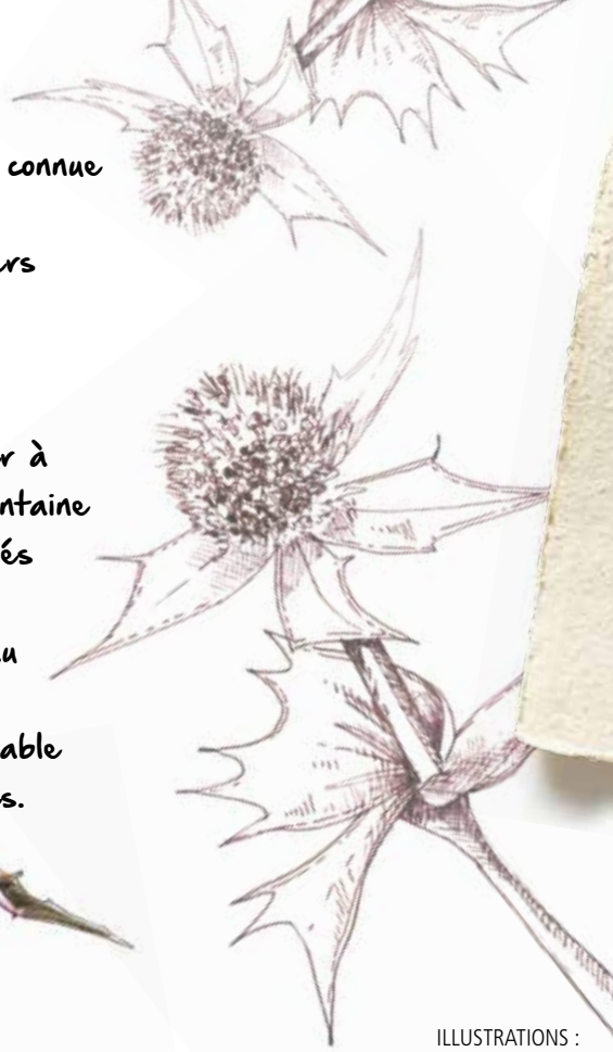
ILLUSTRATIONS : Sébastien Hasbrouck du Muséum départemental du Var