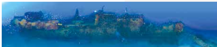
Panoramique de L'épave du Donator • @ Nicolas Barraqué