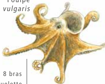
Poulpe Octopus vulgaris