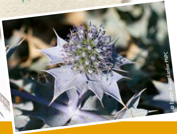
@ Équipe du cap Lardier PNPC