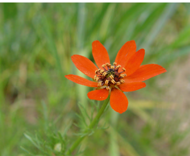
■ L'Adonis couleur de feu ( Adonis vernalis ), une espèce "Quasi menacée" et en déclin

L'état des lieux mené dans le cadre de la Liste rouge nationale a porté sur l'ensemble de la flore vasculaire du territoire métropolitain, afin de mesurer le degré de menace pesant sur chacune des espèces et sous-espèces.