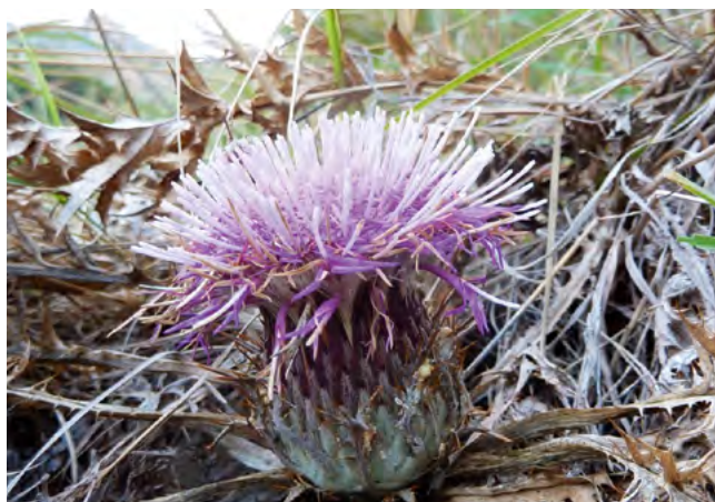
■ La Carlina à gomme ( Carlina gummifera ), disparue de France métropolitaine

* X : espèce endémique de France métropolitaine.