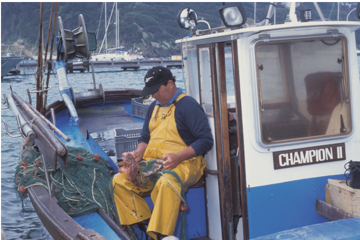
Pêcheur démaillant ses filets, photothèque du parc national de Port-Cros © Laurent Gaignerot