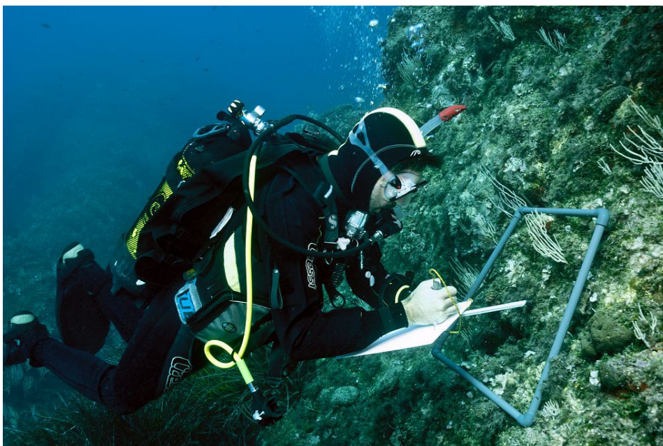
Suivi gorgones blanches, photothèque du parc national de Port-Cros © Hereu Bernat

Les établissements publics de parcs nationaux, utilisateurs de résultats de recherche dans de nombreuses disciplines, et les chercheurs, demandeurs de territoires à forte naturalité, de séries longues d'observation et de structure d'appui pour accéder rapidement à la connaissance d'un territoire, et bénéficier des synthèses et données et de l'appui logistique éventuel des parcs, peuvent trouver bénéfice mutuel à travailler ensemble.