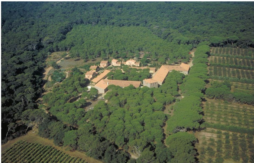
Le Hameau – Ile de Porquerolles

https://www.economie.gouv.fr/plan-de-relance/profils/administrations