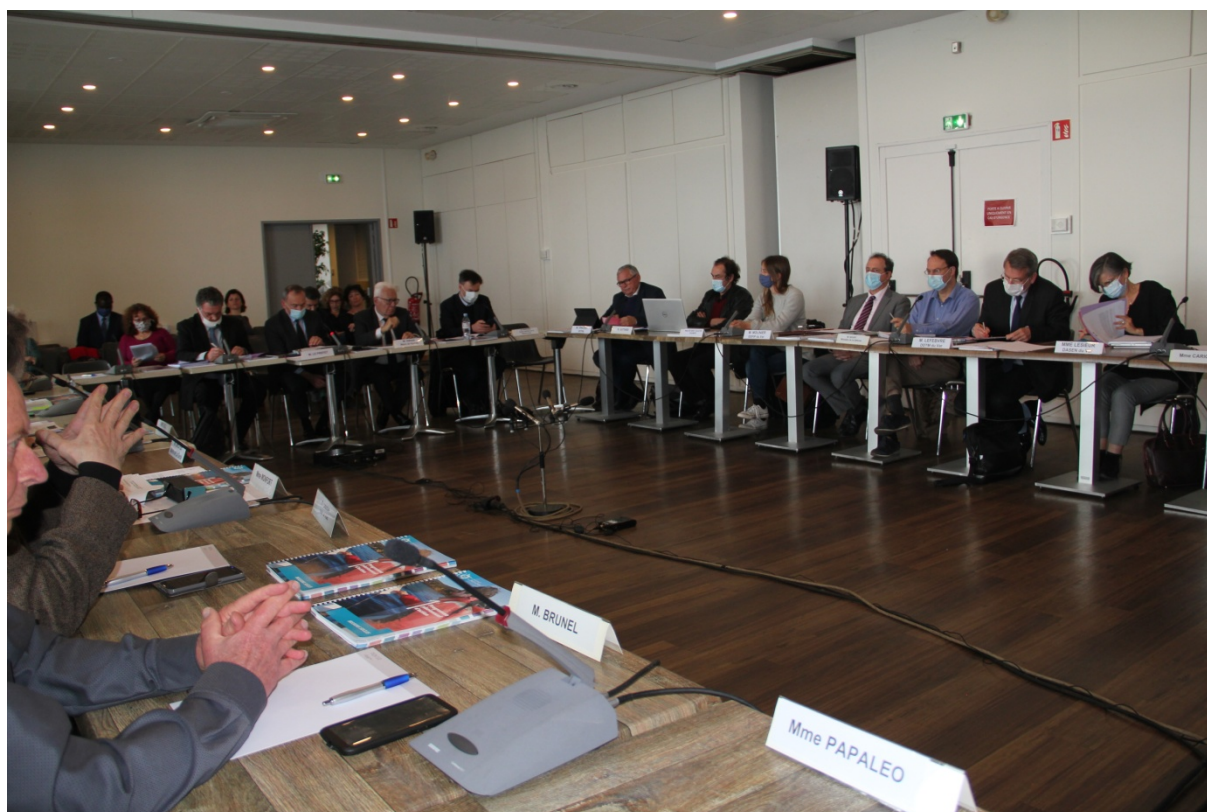
Les membres du Conseil d'administration du Parc national de Port-Cros, réunis le 10 mars 2022.