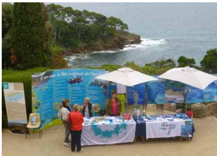
Le stand du Parc et de Pelagos