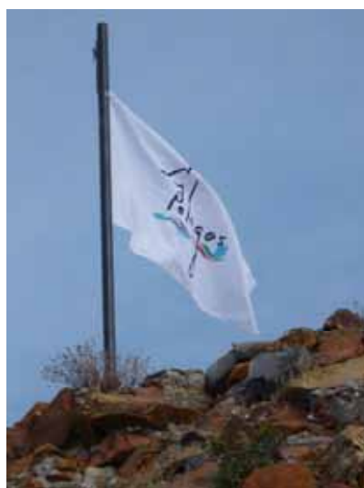
Le pavillon Pelagos pour les communes signataires de la