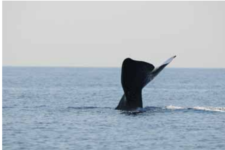
Cachalot photographié lors d'une prospection