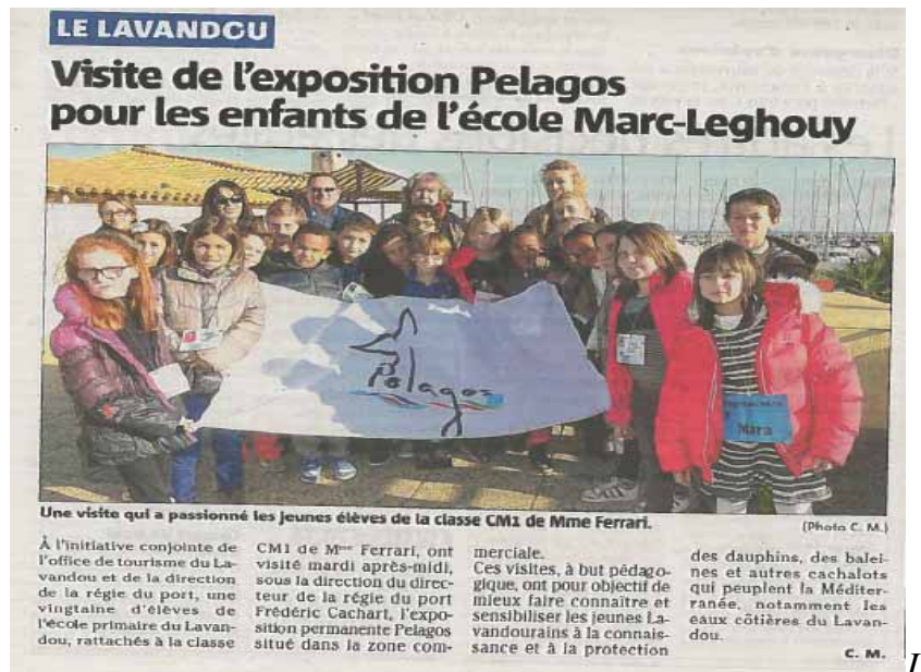
a visite de la maison des cétacés par une classe de CM1