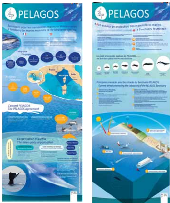
Les kakémonos Pelagos ré-édités en 2014