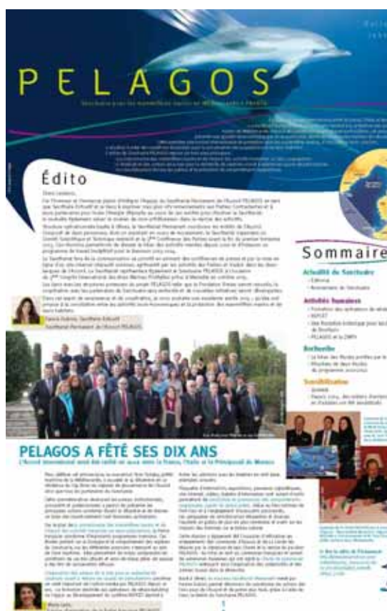
La Une du Bulletin PELAGOS 2013

Cet outil est particulièrement apprécié des partenaires de la Partie française, il renforce les liens entre tous, valorise le travail de chacun et tient informé de l'état d'avancement des projets.