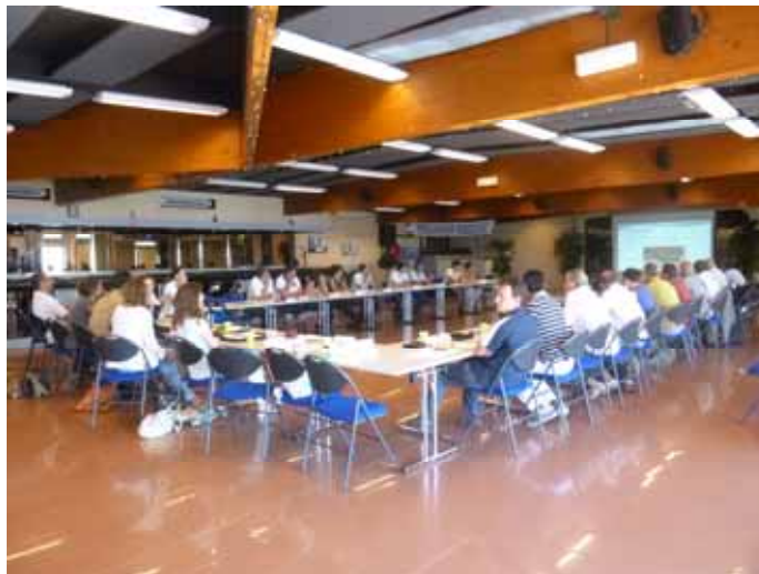
Hyères, le 18 juin 2013.

Il est à noter qu'à la suite de cette enrichissante réunion, le Comité Scientifique et Technique de Pelagos a adopté le projet d'une action tripartite en 2014 avec toutes les communes, françaises et italiennes, signataires de la Charte Pelagos.