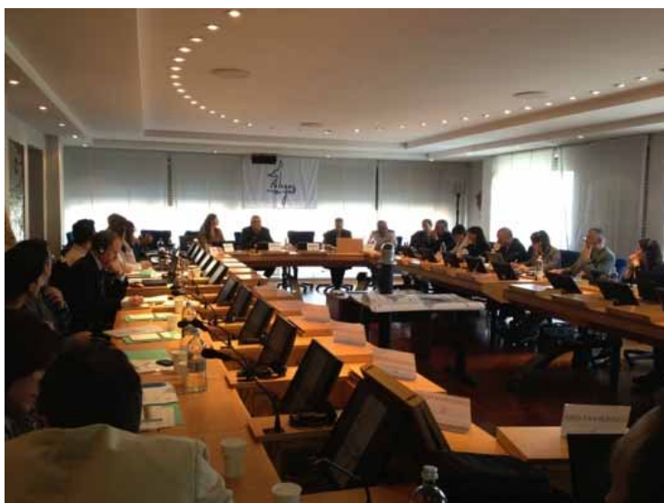
5 ème Conférence des Parties du Sanctuaire Pelagos. Rome, 4 et 5 juin 2013

Évènement marquant la reprise des activités tripartites depuis la fermeture du Secrétariat Permanent en 2010, la Conférence des Parties a permis d'établir le bilan des activités menées par les Parties Contractantes depuis la 4 ème Conférence des Parties (Monaco, novembre 2009), d'adopter le budget et le programme de travail pour le biennium 2013-2014, et d'identifier les actions prioritaires à mener telles que la réalisation de la synthèse des activités et des connaissances sur les mammifères marins dans le Sanctuaire Pelagos, et enfin le lancement d'un appel à projet financé sur les reliquats financiers de l'Accord.