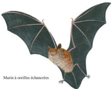
Murin à oreilles échanquées

Les chauves-souris ne se servent pas de leurs yeux. Pour autant elles ne sont pas aveugles. Elles émettent des ultrasons, par la bouche ou le nez suivant l'espèce, qui forment une image auditive de leurs proies et des obstacles. C'est l'écholocation. Elles émettent aussi des cris, que l'homme peut entendre, qui ont une fonction de communication sociale.