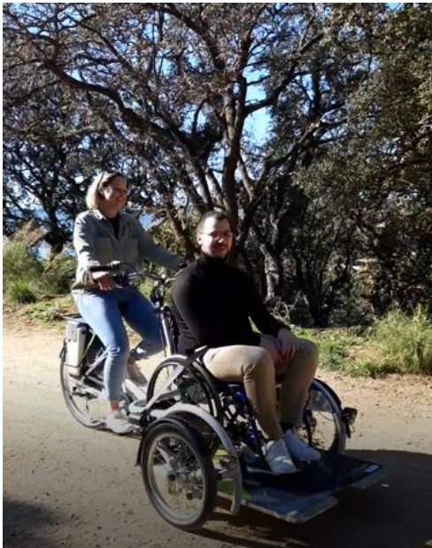
Figura 2: Prova della bicicletta Evol Mobilités