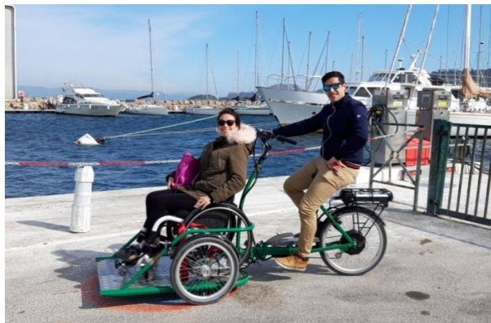
Figura 3: Prova della bicicletta Marconnet Technologies

Il modello emerso come più resistente e conforme alla richiesta in seguito alle due prove è la bicicletta con pedana dell'azienda Marconnet Technologies (foto di destra). I criteri principali della valutazione sono stati il peso del materiale, l'altezza della pedana e la potenza e autonomia della batteria per la pedalata assistita.