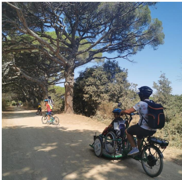
Figura 5: La bicicletta in azione per grandi e piccini

Da un punto di vista generale, la bicicletta con pedana per le persone in sedia a rotelle messa a disposizione per la stagione estiva del 2020 sull'isola di Porquerolles ha avuto un bel successo. In un primo momento, l'accoglienza da parte di abitanti e commercianti ha costituito un elemento molto importante di cui tenere conto poiché, come mostrato nella tabella, il passaparola ha funzionato.