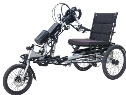
Figura 6: la handbike - Marconnet Technologies

Lo scopo di questi investimenti non è quello di rendere competitiva l'offerta di mezzi che consentono alle persone con disabilità di scoprire l'isola tramite l'acquisto di diversi materiali, ma di proporre alcune soluzioni per garantire l'inclusione di tutte le tipologie di pubblico e l'accesso alla natura senza distinzioni, intento che corrisponde a una delle principali missioni di un Parco nazionale.