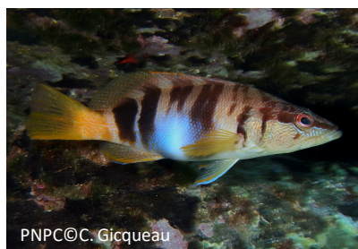
Serran écriture Serranus scriba