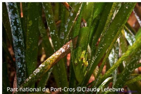
Posidonie Posidonia oceanica

Les vestiges du quai romain et de l'épave de la Tartane, offrent un refuge aux juvéniles d'une grande diversité d'espèce. Les biotopes présents sont : fond rocheux, fond de sable, herbier de posidonie, le tout sur des profondeurs n'excédant pas 5 mètres.