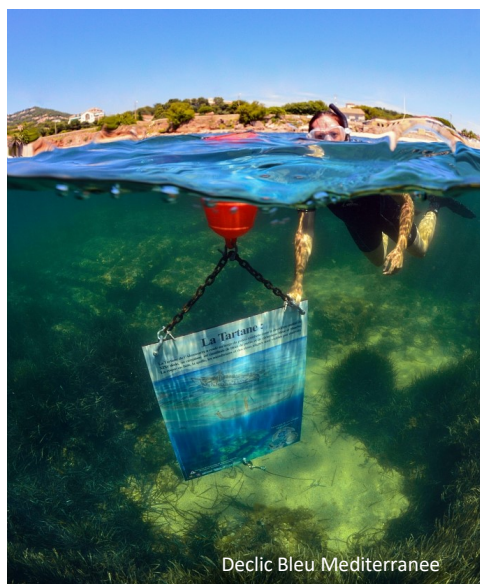
Declic Bleu Mediterranee

Le sentier sous-marin d'Olbia se trouve sur les vestiges d'un quai romain, à proximité d'une épave de Tartane, chargée de blocs de pierre qui offrent un refuge à de nombreuses espèces aquatiques.