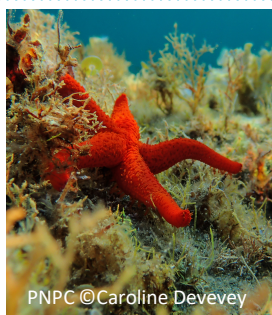
Etoile de mer rouge Echinaster sepositus