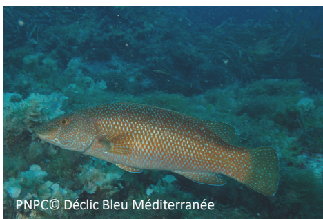
Labre vert Labrus viridis