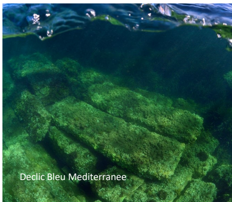
Declic Bleu Mediterranee