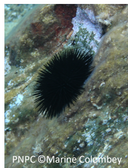
Oursin noir Arbacia lixula