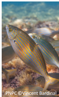
Saupe Sarpa salpa