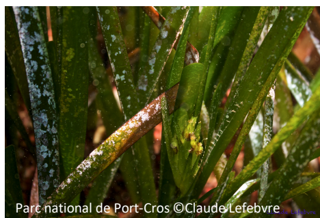
Posidonie Posidonia oceanica