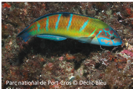
Girelle Paon Octopus vulgaris

Le sentier sous-marin de la Garonne regroupe plusieurs types de milieu (roches, herbiers, pleine eau) qui permettent l'observation d'une grande diversité d'espèces. A chaque milieu, sa bouée pédagogique.