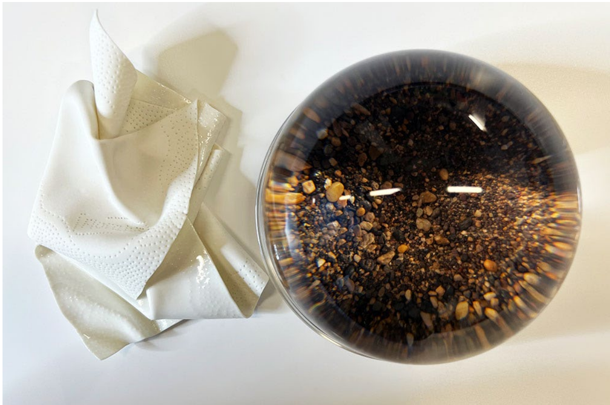
Les traces qu'on laisse, Anne-Laure Wuillai

Le vernissage a lieu samedi 3 juin à 11h, en présence des artistes.